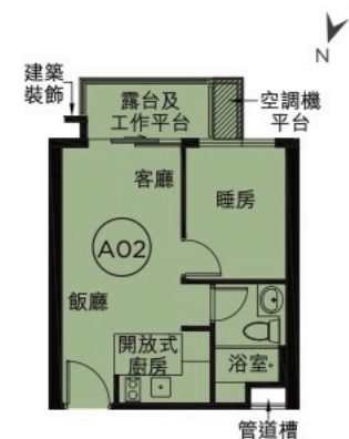
第1座8樓A02室 1房單位平面圖