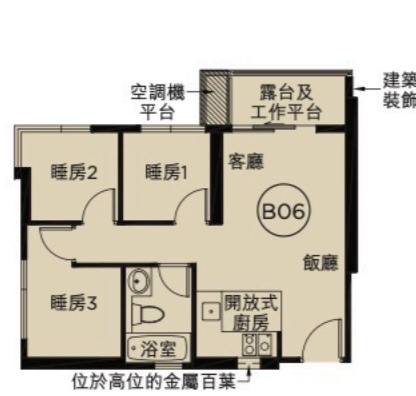
第3座8樓B06室 3房單位平面圖